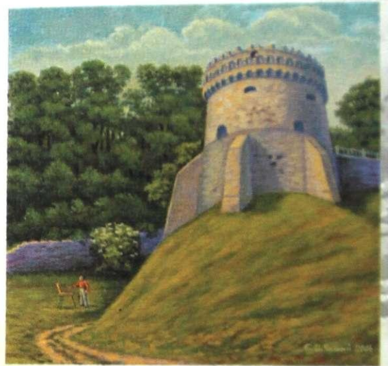
Є. ЧОРНИЙ „Острог. На етюдах”, п/о