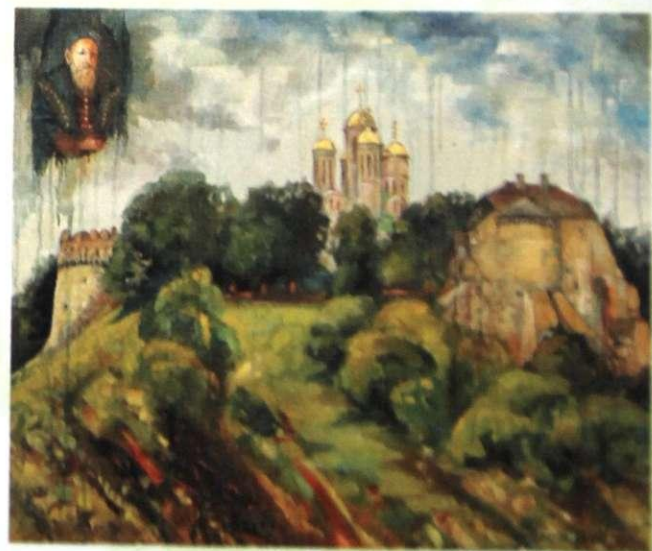
В.МАРТИНЧУК „Дощі часу”, п/о