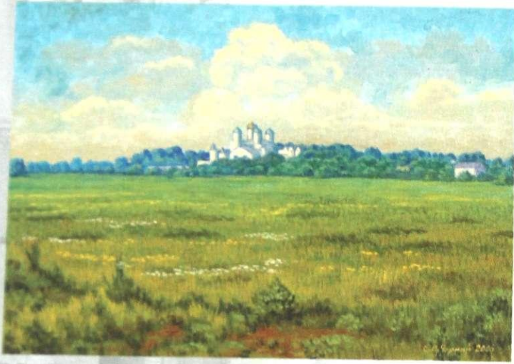
Є. ЧОРНИЙ „Межиріцький монастир”, п/о